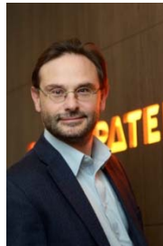
Pete Pollard Salted Patent